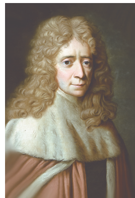
Мал. 18. Ш. Л. Мантэск’ё (1689–1755)

Клуб знаўцаў-эканамікагеографай. Вядомы французскі асветнік Шарль Луі Мантэск’ё (мал. 18) лічыў, што форма дзяржаўнага кіравання і ладу абумоўлена кліматам і памерам краіны. Навуковец пісаў, што аптымальнай будзе форма дзяржаўнага