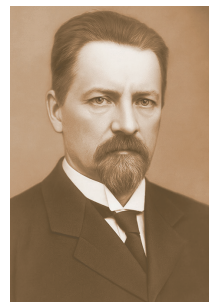
Мал. 25. Р. Чэлен (1864–1922), аўтар тэрміна «геапалітыка»

Адно з першых азначэнняў характарызавала геапалітыку як навуку пра геаграфічную абумоўленасць розных палітычных працэсаў. Шведскі географ Р. Чэлен (мал. 25) першым увёў паняцце «геапалітыка».