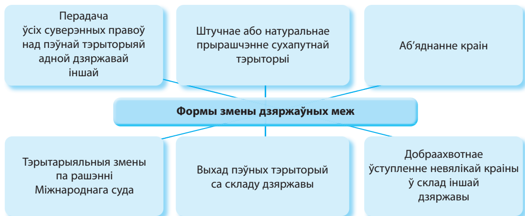
Мал. 23. Формы змены дзяржаўных меж