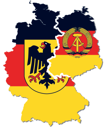
Мал. 24. Тэрыторыя ФРГ пасля аб'яднання з ГДР

Рэсурсныя памежныя спрэчкі складаюць значную частку канфліктаў пры асваенні прыродных рэсурсаў на кантынентальным шэльфе (нафта, газ), пры недахопе водных рэсурсаў у засушлівых раёнах (напрыклад, Малі і Буркіна-Фасо, Турцыя і Сірыя). Для вырашэння такіх спрэчак прымаюць рашэнне аб сумесным выкарыстанні рэсурсаў (напрыклад, гідраэнергапатэнцыял ракі Парана паміж Бразіліяй і Парагваем) або вызначаюць сектары з дакладнымі межамі дзяржаў (напрыклад, падзел нафтагазавых рэсурсаў Паўночнага мора паміж прыбярэжнымі дзяржавамі).