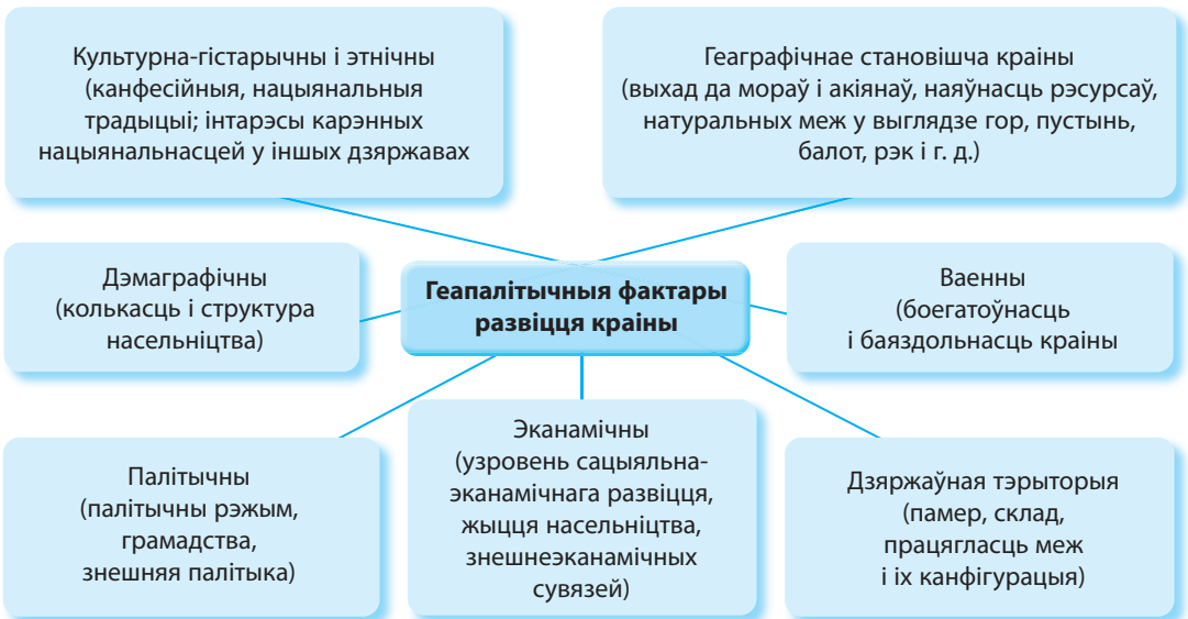
Мал. 27. Геапалітычныя фактары развіцця краіны

Эканамічна развітыя краіны і шэраг краін, якія развіваюцца, у цяперашні час імкнуцца заняць больш моцную пазіцыю ў свеце. Таму яны надаюць увагу найбольш