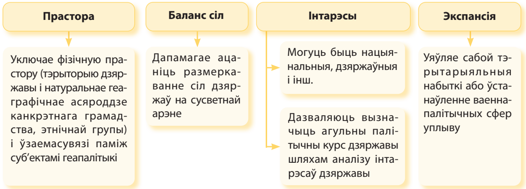
Мал. 26. Асноўныя паняцці геапалітыкі

Усходняй Сібіры і Далёкага Усходу, тэрыторыі былога СССР, нацыянальнасці якіх пражывалі ў некалькіх рэспубліках (напрыклад, рускія ў БССР, рускія ў Казахстане).