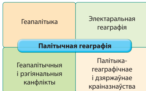
Мал. 21. Асноўныя напрамкі палітычнай геаграфіі