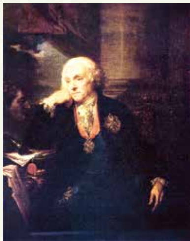
Яўхім Храптовіч. 1809 г.