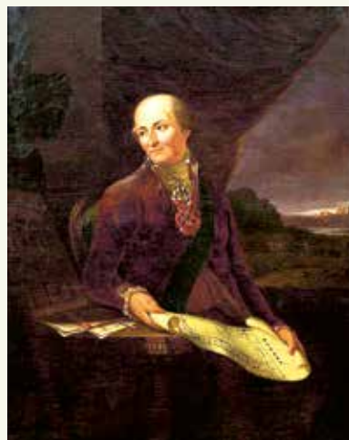
Антоній Тызенгаўз. 1850 г.