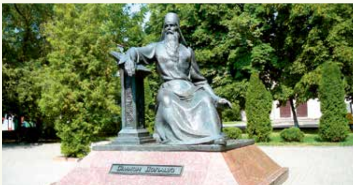
Помнік Сімяону Полацкаму. Скульптар А. Фінскі, архітэктары Г. Фёдарыў і Н. Цавік. 2003 г.