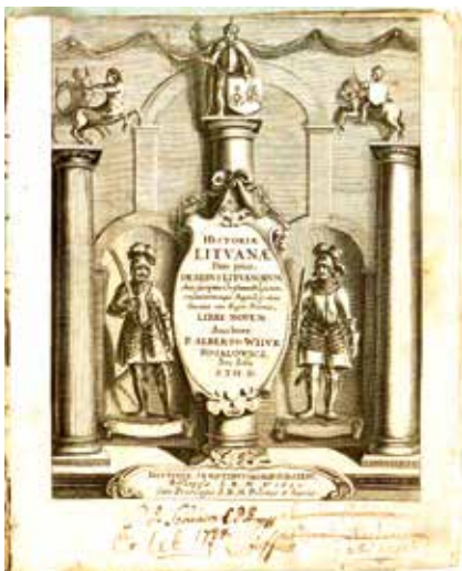
Тытульны аркуш «Гісторыі Літвы». 1650 г.