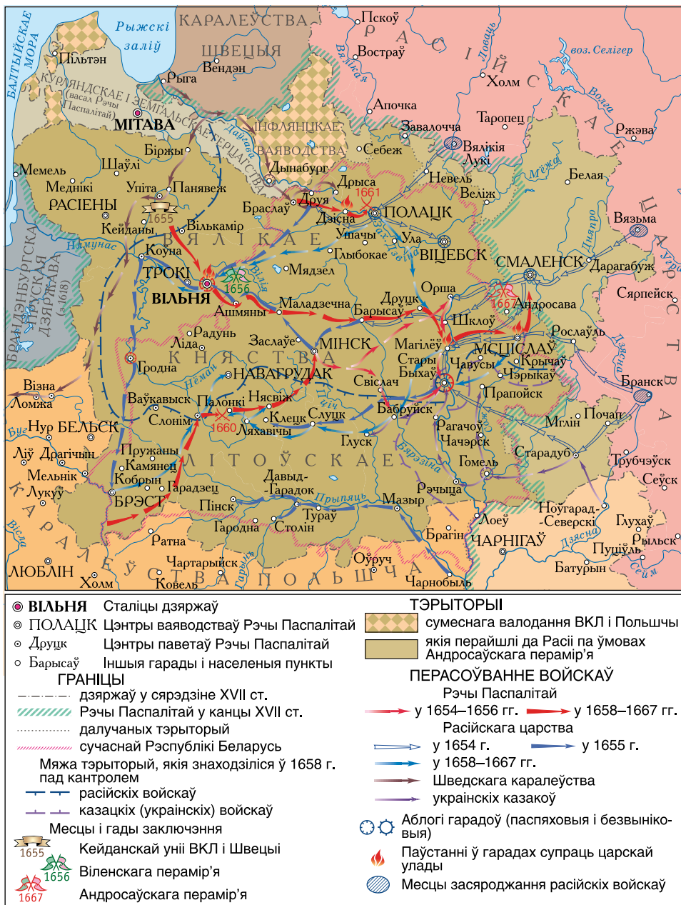
Тэрыторыя Беларусі ў вайне Расійскай дзяржавы з Рэччу Паспалітай 1654–1667 гг.

Скарытайцеся картасемай і дапоўніце інфармацыю аб падзеях вайны 1654–1667 гг.