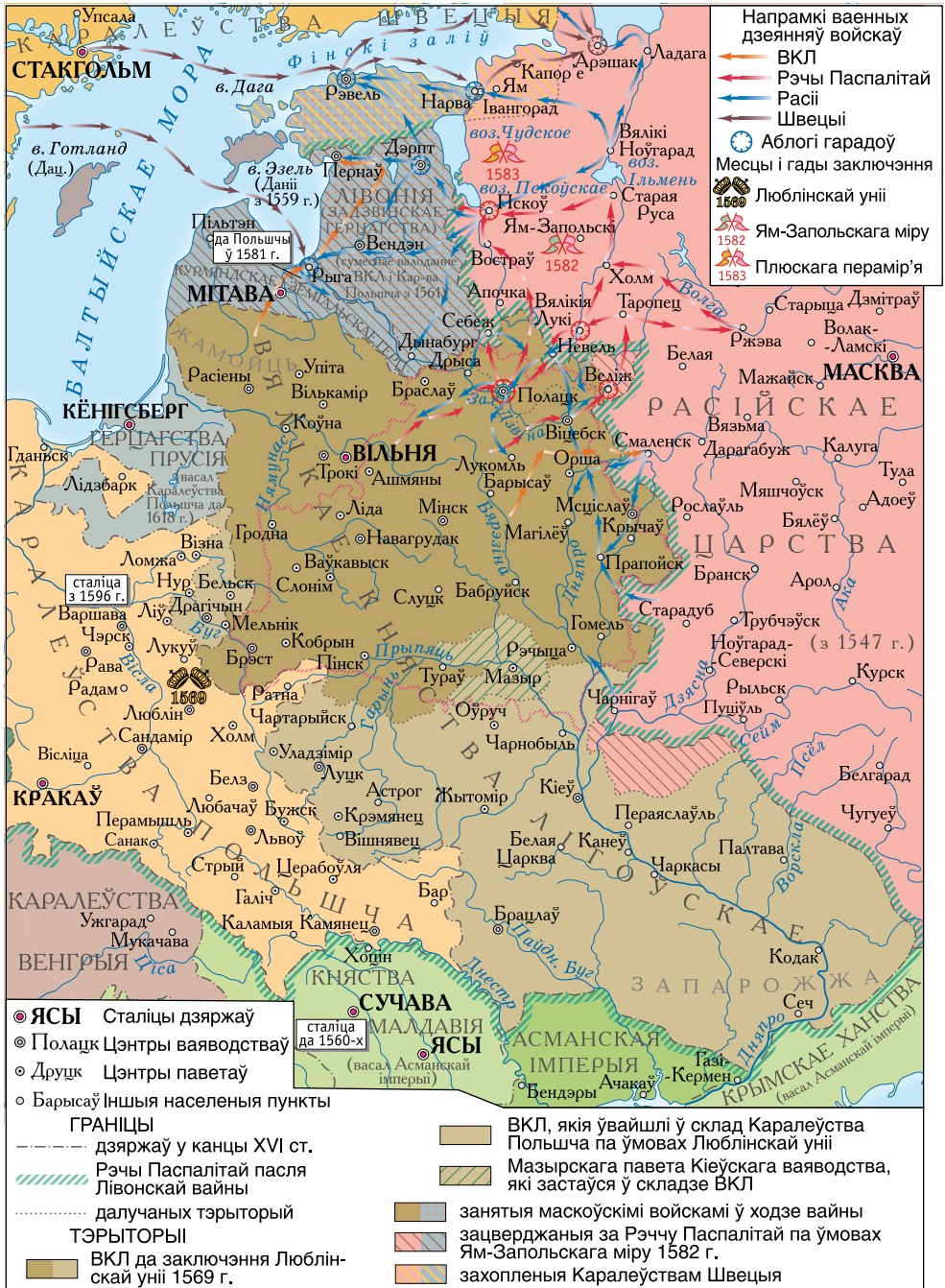
Лівонская вайна 1558–1583 г.