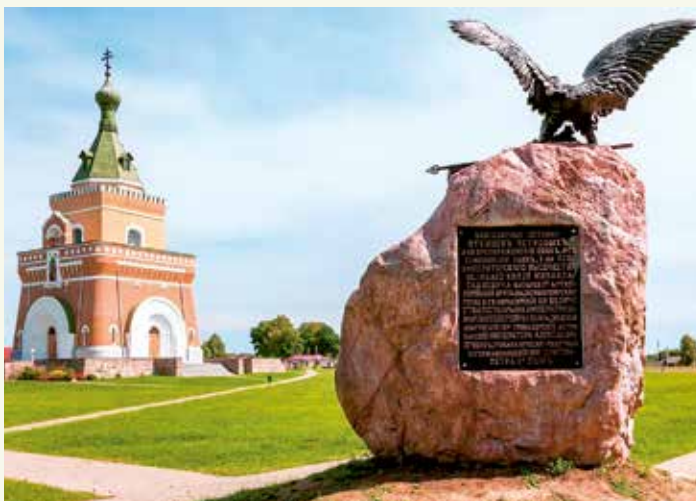
Мемарыяльны комплекс на месцы бітвы каля в. Лясной. Слаўгарадскі раён Магілёўскай вобласці

Паўночная вайна прынесла Беларусі вялікія страты. Былі цалкам разбураны Мір, Клецк, Нясвіж, Карэлічы, Ляхавічы, разрабаваныя Гродна, Пінск, Мінск, Навагрудак, Ліда, Магілёў, насельніцтва скарацілася на траціну.