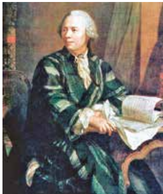
Партрэт Леанарда Эйлера. Мастак Я. Э. Хандман. 1756 г.

Выкарыстоўваючы дадатковыя крыніцы інфармацыі, даведайцеся, як вядомы матэматык і механік Л. Эйлер звязаны з Санкт-Пецярбургам.