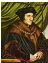
Томас Мор. XVI ст.