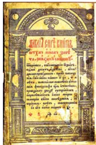
Астрожская Біблія. 1581 г.

6. Культура Усходу ў XIV–XVI стст. Культура Усходу ў XIV–XVI стст. дасягнула значных поспехаў. У галіне мастацтва яна не саступала еўрапейскай. У адрозненне ад яе развівалася ў рэчышчы традыцыі і ў згодзе з рэлігіяй, не змяняючы светапогляду людзей, іх уяўленняў пра сябе, грамадства і навакольны свет.