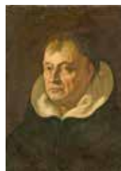
Тамаза Кампанела. XVI ст.