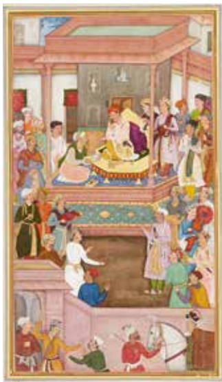
Абу-л Фазл Аламі падносіць падышаху Акбару кнігу «Акбар-намэ». Мініяцюра. 1596–1597 гг.

У Кітаі дынастыя Мін таксама пакінула яркія следы ў культуры. Гэты перыяд быў часам вялікіх адкрыццяў і гандлёвых экспедыцый, у тым ліку знакамітых марскіх экспедыцый адмірала Чжэн Хэ. У мастацтве пераважалі жывапіс і кераміка, якія славіліся высокім узроўнем майстэрства. Мінская кераміка, асабліва фарфор, зрабілася вядомай ва ўсім свеце. У гэты ж перыяд былі створаны выбітныя раманы кітайскай літаратуры: «Траяцарства» (XIV ст.), «Рачныя затокі» (каля XV ст.), «Падарожжа на Запад» (XVI ст.), перакладзеныя на рускую мову.