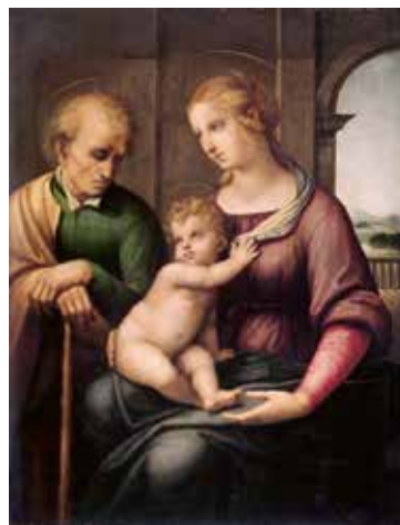
Святое сямейства. Рафаэль Санці. 1506 г.

Даведайцеся, каго і чаму называюць «тытанамі Адраджэння».