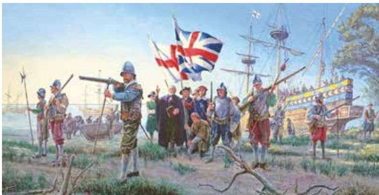
Англіійскія каланісты ў Амерыцы

карысныя выкапні і г. д.). Паміж Еўропай, Афрыкай і Амерыкай ужо ў XVI ст. склаўся так званы «гандлёвы трохвугольнік». Упершыню ў гісторыі пачалося фарміраванне глабальнай гандлёва-эканамічнай сістэмы.