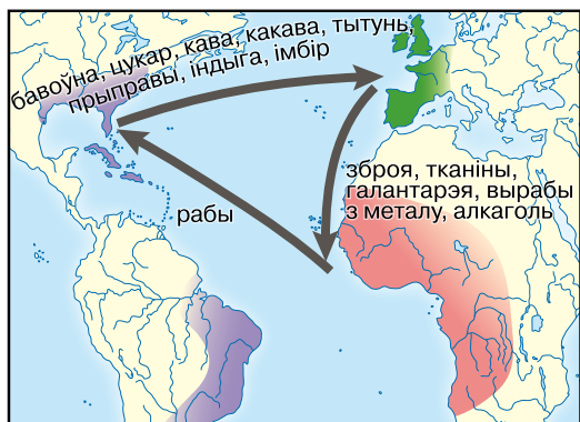
«Гандлёвы трохвугольнік» Новага часу

карысныя выкапні і г. д.). Паміж Еўропай, Афрыкай і Амерыкай ужо ў XVI ст. склаўся так званы «гандлёвы трохвугольнік». Упершыню ў гісторыі пачалося фарміраванне глабальнай гандлёва-эканамічнай сістэмы.