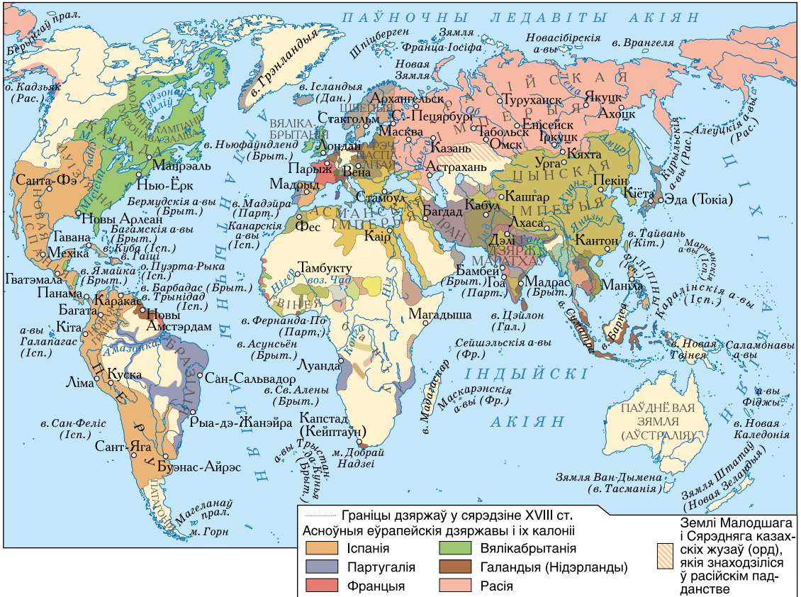
Свет у сярэдзіне XVIII ст.

2. Стварэнне каланіяльных імперыяў. У працэсе каланізацыі паўсталі гіганцкія каланіяльныя імперыі: спярша Іспанская і Партугальская, праз некаторы час — Англіійская і Французская. Стварэнне каланіяльных імперыяў Іспаніі і Партугаліі — адзін з найважнейшых этапаў гісторыі Еўропы і свету