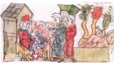
Гульня ў косці. Мініяцюра Радзівілаўскага летапісу. XV ст.

Успомніце, што такое летапіс. Чаму гэты жанр літаратурных твораў з'яўляецца найбольш каштоўным для гісторыкаў?