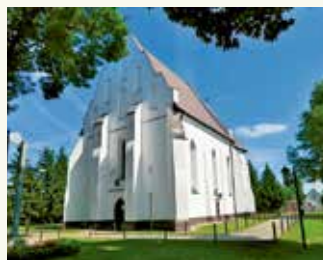
Касцёл Святой Тройцы. В. Ішкальдзь. Баранавіцкі раён Брэсцкай вобласці

3. Літаратура. Развіццю беларускай літаратуры ў XIV–XV стст. спрыяла тое, што старабеларуская мова мела ў Вялікім Княстве Літоўскім статус дзяржаўнай. Аснову літаратуры складалі, як і раней, творы рэлігійнага характару — кнігі для набажэнстваў, Біблія, у тым ліку евангеллі, а таксама жыцці, павучанні і інш. У гэты час з’явіліся першыя пераклады рэлігійнай літаратуры на старабеларускую мову.