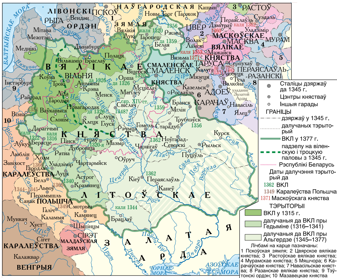
Пашырэнне тэрыторыі ВКЛ у 1315–1377 гг.

беларусаў і ўкраінцаў. Літоўскі элемент намагаўся дамінаваць у палітычнай, а ўсходнеславянскі — у культурнай і эканамічнай галінах жыцця ВКЛ. Старабеларуская («руская») мова з’яўлялася афіцыйнай мовай дзяржавы.