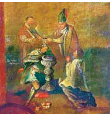
Хрышчэнне Міндоўга. Невядомы аўтар

2. Прычыны ўтварэння новай дзяржавы. Утварэнне Вялікага Княства Літоўскага было абумоўлена шэрагам прычын. З аднаго боку, гэта працэсы, якія адбываліся ў літоўскіх плямёнах: з'яўленне няроў-