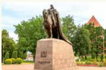
Помнік Гедыміну ў г. Ліда

Б. Загадам Гедыміна было распачата будаўніцтва каменных замкаў па лініі Трокі — Вільня — Меднікі — Гародня — Новагародак — Ліда — Крэва — Мядзел.