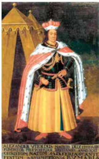
Вялікі князь літоўскі Вітаўт. Партрэт з Брэсцкага аўгусцінскага манастыра. Невядомы аўтар. Другая палова XVII ст.

Даведайцеся, пры якіх абставінах была сарвана караная Вітаўта.