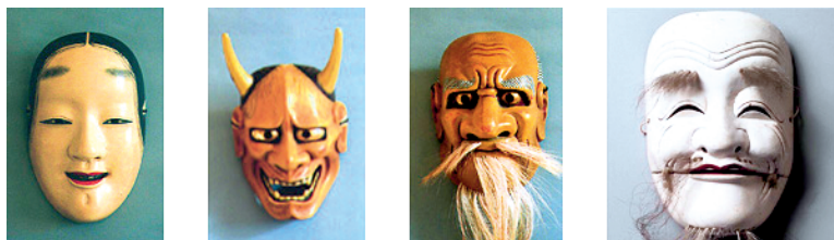
Маскі тэатра Но

Японія таксама мае багатую культурную і навуковую спадчыну. Яна ўключае каліграфію, тэатр Но і ўнікальнае мастацтва чайнай цырымоніі. Тэатр Но незвычайны для еўрапейцаў. Акцёры ў ім ігралі