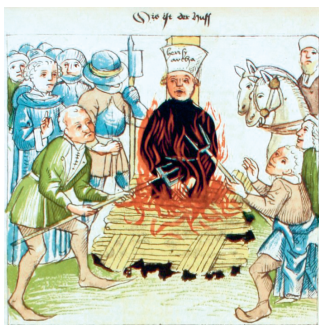
Спаленне Яна Гуса. Мініяцюра. XV ст.

Якія фактары паспрыялі заняпаду ўплыву рымскіх пап у Познім сярэднявеччы?