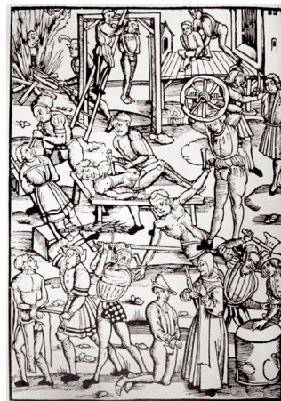
Катаванні, узаконеныя царквой. Гравюра. 1508 г.

Нягледзячы на пераслед, ідэі ератыкоў не зніклі. Яны падрыхтавалі глебу для Рэфармацыі, якая ў XVI ст. змяніла хрысціянскую Еўропу. Крытыка