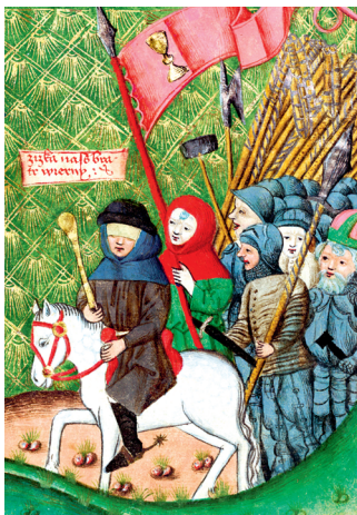
Ян Жыжка. Мініяцюра. XV ст.

Гусіцкі рух, які паўстаў у XV ст. у Чэхіі, быў важным этапам у гісторыі хрысціянства і ранніх рэформаў. Ён змагаўся супраць карупцыі ў царкве, прапагандаваў ідэі роўнасці і доступу да Бібліі. Гэты рух