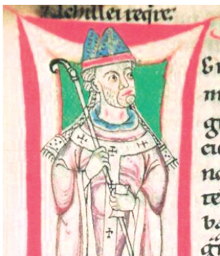
Рымскі папа Грыгорый VII. «Жыццё Грыгорыя VII». Павел Бернрыдынскі. Першая палова XII ст.

Аднак духавенства імкнулася супрацьстаяць негатыўным працэсам у каталіцкай царкве. Так узнік рух рэформаў на чале з абацтвам Клюні (Францыя). Рух гэты падпарадкоўваўся непасрэдна папу. Клюнінскія рэформы мелі мэтай умацаваць папскую ўладу, забараніць продаж царкоўных пасадаў і абмежаваць умяшанне свецкіх улад у царкоўныя справы. У сценах абацтва паўстала адна з найбольш уплывовых постацей у гісторыі каталіцкай царквы — папа Грыгорый VII (1073–1085 гг.), які фактычна ўзначальваў Ватыкан з 1059 г. Ён рэфармаваў выбары пап, вызваліў іх ад свецкага ўплыву, увёў цэлібат — бяслюбнасць для духавенства — і выступаў за вяршэнства папы над свецкімі ўладамі. Асаблівую вастрыву мела яго барацьба з германскім імператарам Генрыхам IV, якога ён прымусіў з’явіцца ў Каносу з пакаяннем. Папа