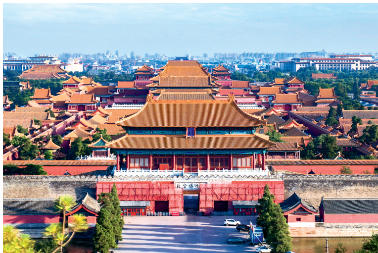
Забаронены горад. Пекін, Кітай. Сучасны выгляд