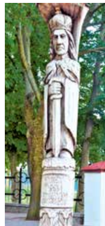
Помнік у г. Гродна

Таксама і турэцкі цар ушанаванні вялікія з дарункамі многімі падаваў. Слаўны гасудар, дабраверны і хрыстальюбны цар Канстанцінопальскі і той з ім у вялікай любові жыў. Таксама і Чэшскае каралеўства вялікую дружбу трымала са слаўным гасударом. Яшчэ і данскі кароль вялікую пашану выказваў, і дары многія падносіў слаўнаму валадару... У тыя ж гады брат яго