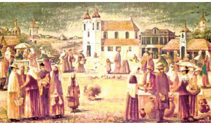
Кирмаш. Художник А. Суша

3. «Золотым веком» развития ярмарок в Западной Европе была эпоха Средневековья. На территории Беларуси на регулярной основе эта форма торговли получила распространение с конца XV в., а наивысшего расцвета достигла в XVIII — начале XIX в. Ярмарки («кир-маши») были приурочены к различным христианским праздникам и длились от недели до месяца.