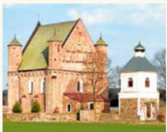
Церковь Святого Михаила. Д. Сынковичи. Зельвенский район Гродненской области