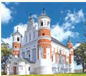
Церковь Рождества Богородицы. Д. Мурованка. Щучинский район Гродненской области