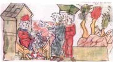
Игра в кости. Миниатюра Радзивилловской летописи. XV в.

Вспомните, что такое летопись. Почему данный жанр литературных произведений является наиболее ценным для историков?