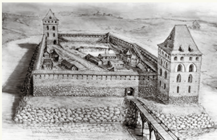
Замок в Крево. Реконструкция