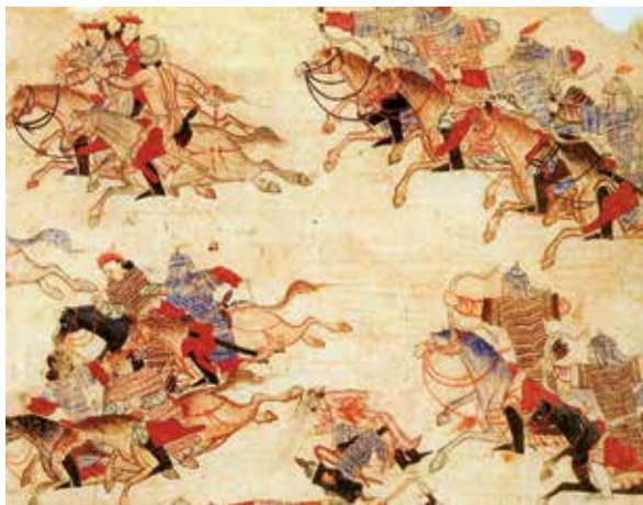
Миниатюра из «Сборника летописей». XV в.

Результатом замедления развития цивилизаций Востока в Позднем средневековье стала их неспособность противостоять европейской колониальной экспансии в Новое время.