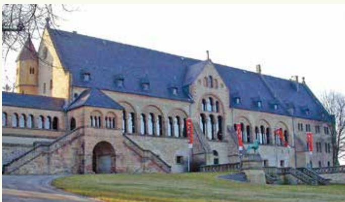
Императорский дворец. Г. Гёслар. Современный вид

В Средневековье сложились разнообразные типы и формы городского права. Причем законы, разработанные в одних городах, часто становились типовыми и для других (например, магдебургское право, любекское право и др.).