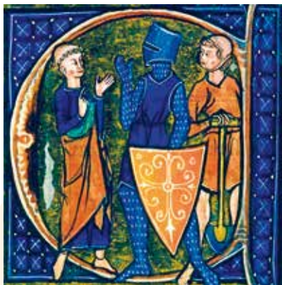
Миниатюра XIII в.

Укажите, представители каких сословий изображены на миниатюре. По каким критериям вы это определили?