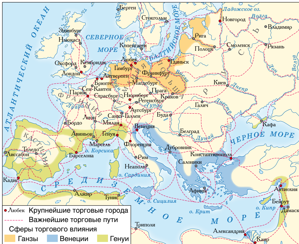
Развитие городов и торговли в Европе в Высоком средневековье

бителями. Центральной фигурой торговли стал купец. Первоначально купцами становились разбогатевшие ремесленники, которые снабжали коллег сырьем и организовывали сбыт готовой продукции. Обычно они наследовали свой статус.