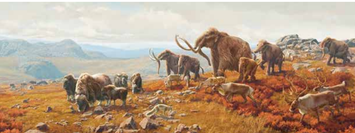
Фауна тундры ледникового периода.

На нашей планете периодически происходили глобальные похолодания ( ледниковые периоды ), приво-