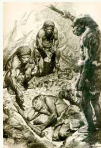
Погребение в Ле-Мустье. Художник З. Буриан

Какие выводы о неандертальцах можно сделать на основе этой находки?