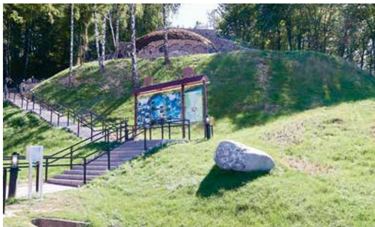
Музей-стоянка первобытного человека. Д. Юровичи. Калинковичский район Гомельской области

12 тыс. лет до н. э. ледник окончательно отступил с территории Беларуси. После этого началось быстрое заселение территории с запада и юго-востока. Полностью белорусские земли, хотя и неравномерно, были заселены в период среднего каменного века (мезолита). Известно более 120 древних поселений того времени, в основном они располагались на берегах крупнейших рек — Днепра, Припяти, Немана и их притоков. С этого времени активная жизнедеятельность на наших землях больше не прекращалась.