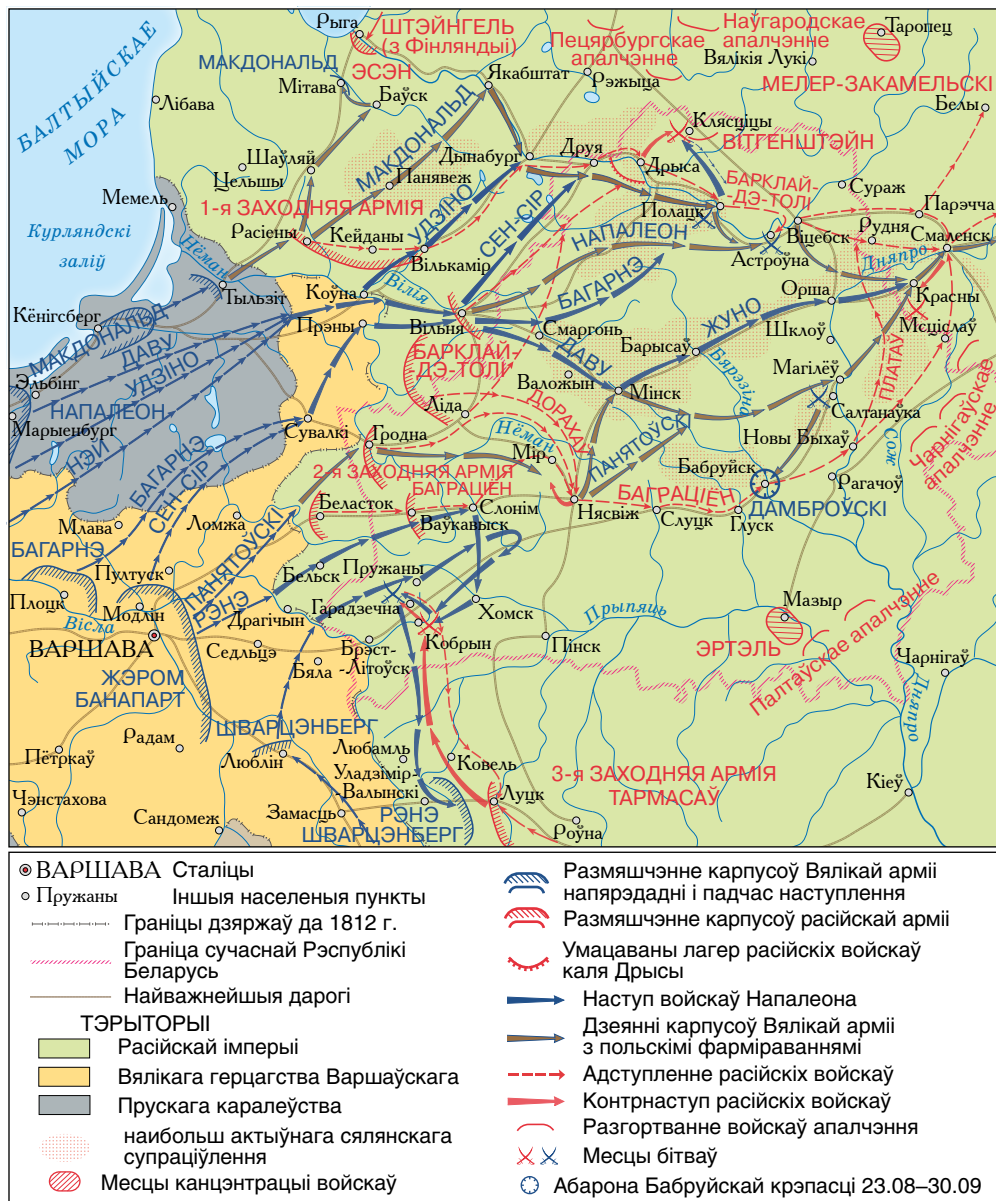
Вайна 1812 г. на тэрыторыі Беларусі