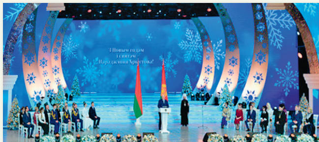
Цырымонія ўручэння прэміі Прэзідэнта Рэспублікі Беларусь «За духоўнае адраджэнне». 2025 г.