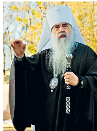
Герой Беларусі Мітрапаліт Філарэт (Вахрамееў)

Беларуская дзяржава ў поўнай меры забяспечвае рэалізацыю права на свабоду сумлення, дае