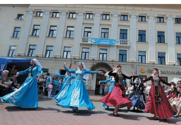
Фестываль нацыянальных культур. Г. Гродна. 2024 г.