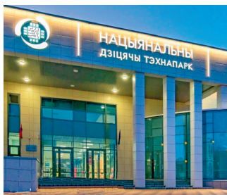
Нацыянальны дзіцячы тэхнапарк. Г. Мінск

Канстытуцыя гарантуе грамадзянам Рэспублікі Беларусь права на ахову здароўя, у тым ліку на бясплатнае лячэнне за кошт дзяржаўных сродкаў у парадку, устаноўленым законам. Пры гэтым грамадзяне мусяць клапаціцца пра захаванне ўласнага здароўя.