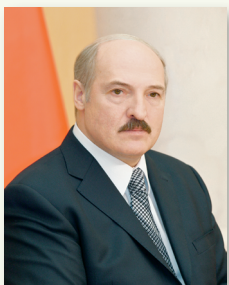
Прэзідэнт Рэспублікі Беларусь А. Р. Лукашэнка

«Здольнасць лідара глыбока асэнсоўваць маштабныя праекты, валявая настойлівасць пры іх вырашэнні, мужнае ўспрыняцце калізій, якія паўстаюць, згуртоўваюць людзей, вакол яго фарміруецца стрыжань нацыі, пад яго кіраўніцтвам краіна набірае сілу і ўпэўнена займае годнае месца ў сусветнай супольнасці» (з кнігі «Наш прэзідэнт»).