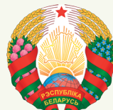
Дзяржаўны герб Рэспублікі Беларусь