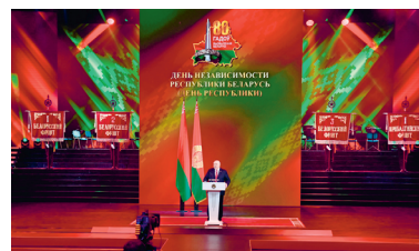
Урачысты сход у гонар Дня Незалежнасці. 2024 г.

Вярхоўны Савет БССР вызначыў Днём Незалежнасці Беларусі дату прыняцця Дэкларацыі аб дзяржаўным суверэнітэце. Аднак большасць жыхароў Беларусі не сталі ўспрымаць гэтую дату як пачатак адліку суверэннай дзяржаўнасці, бо яна была звязаная з разбурэннем савецкай дзяржавы. На рэспубліканскім рэферэндуме 1996 г. з прапановы Прэзідэнта Рэспублікі Беларусь А. Р. Лукашэнкі беларусы выказаліся за перанос святкавання Дня Незалежнасці на 3 ліпеня — дату вызвалення г. Мінска ад нямецка-фашысцкіх захопнікаў.