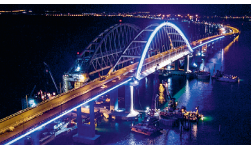
Сімвалам маштабнага будаўніцтва зрабіўся Крымскі мост. Яго працягласць — 19 км. 2018 г.