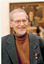
Міхаіл Андрэевіч Савіцкі (1922–2010)