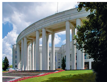
АН БССР узнагароджана ордэнамі Дружбы народаў у 1975 г. і Леніна ў 1978 г.