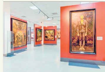
У залах мастацкай галерэі М. Савіцкага (г. Мінск)

Цыкл карцін «Лічбы на сэрцы» М. Савіцкага зрабіўся найбольш вядомай серыяй карцін пра жахі нацысцкіх лагераў смерці. Жывапісец перанёс на палатно тое, праз што прайшоў сам у гады Вялікай Айчыннай вайны: нямецкі палон, лагер смерці.