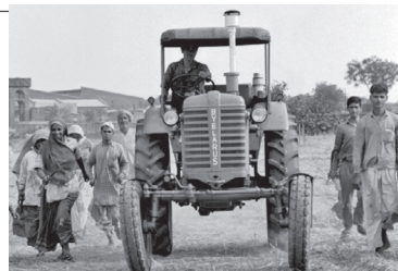
Трактар «Беларусь» у Індыі. 1960-я гг.

Паводле ацэнкі экспертаў Сусветнага банка, у 1991 г. у Беларусі былі адны з найвышэйшых сярод савецкіх рэспублік паказчыкаў даходу на душу насельніцтва, развіты прамысловы сектар, які з улікам яго долі ў ВУП адпавядаў узроўню адной з самых індустрыяльных краін свету. Крызіс у беларускай эканоміцы пачаўся пазней, чым у іншых рэспубліках СССР.