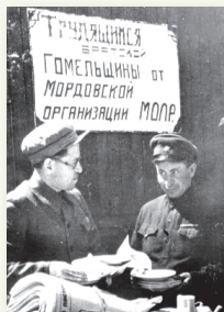
Г. Гомель (другая палова 1940-х гг.)