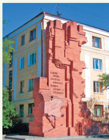
Г. Валгаград (Расійская Федэрацыя)