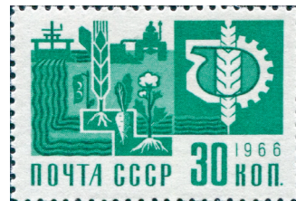
Паштовая марка СССР. 1966 г.

У сярэдзіне 1980-х гг. было заяўлена пра неабходнасць паскарэння сацыяльна-эканамічнага развіцця.