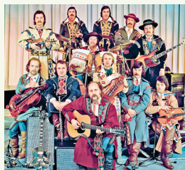
«Залаты» склад «Песняроў»

Вялікі ўнёсак у захаванне і папулярызацыю беларускай мовы зрабілі «Песняры» — самы вядомы беларускі вакальна-інструментальны ансамбль (створаны ў 1969 г. У. Мулявіным). Рэпертуар ансамбля шмат у чым складаўся з рок-адаптацый беларускіх народных песень і песень, напісаных прафесійнымі кампазітарамі на словы беларускіх класікаў (Янкі Купалы, М. Багдановіча і інш.). «Песняры» актыўна ўдзельнічалі ў этнаграфічных экспедыцыях, збіралі матэрыялы пра беларускую народную музыку, знаёмілі гледача з народнымі музычнымі інструментамі і беларускімі народнымі строямі.