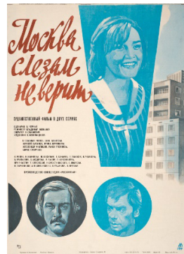
Масква слязам не верыць. Рэжысёр У. Мяньюшэ. 1979 г.