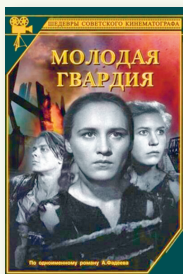
«Маладая гвардыя». Рэжысёр С. Герасімаў. 1948 г.