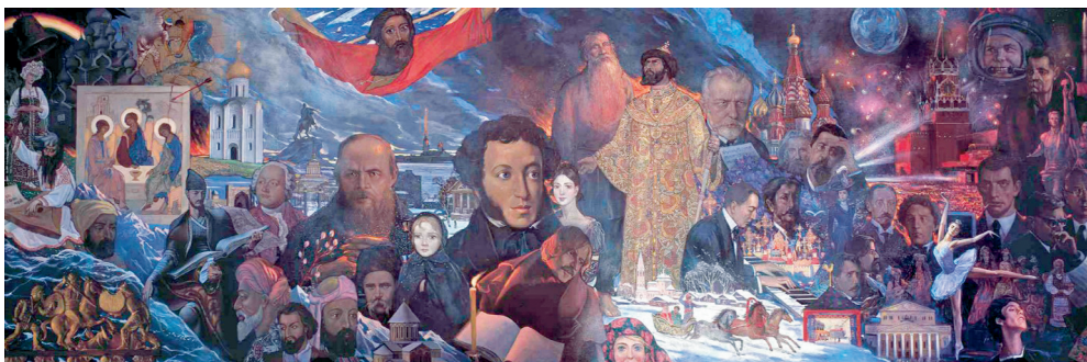
Унёсак народаў СССР у сусветную культуру і цывілізацыю. Мастак І. Глазуноў. 1980 г.

Адным з самых папулярных мастакоў 1970–1980-х гг. быў І. Глазуноў. У 1980 г. ён стварыў пано «Унёсак народаў СССР у сусветную культуру і цывілізацыю», якое было падорана ААН і размешчана ў будынку штаб-кватэры ЮНЕСКА ў Парыжы.