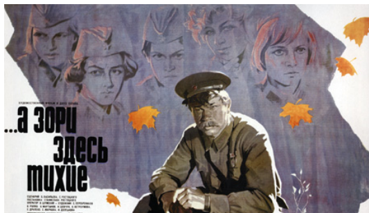
А зоры тут ціхія. Рэжысёр С. Раствоцкі. 1972 г.