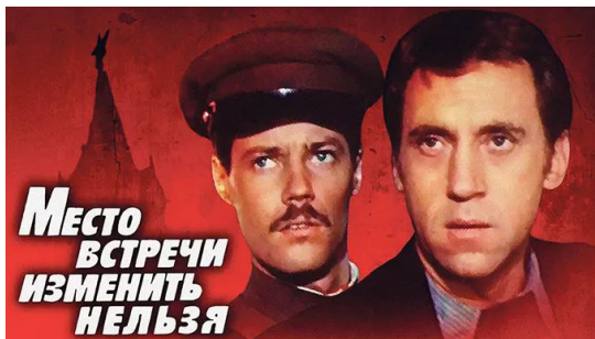
Месца сустрэчы змяніць нельга. Рэжысёр С. Гаварухін. 1979 г.

Якія з савецкіх кінафільмаў атрымалі прэмію «Оскар»?