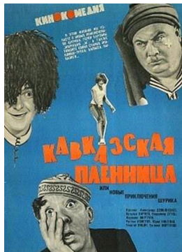
Каўказская нявольніца. Рэжысёр Л. Гайдай. 1967 г.

Перыядам росквіту савецкага кінематографа зрабіліся другая палова 1960-х — 1980-я гг. Менавіта ў гэты час з’явіліся самыя вядомыя савецкія кінашэдэўры.