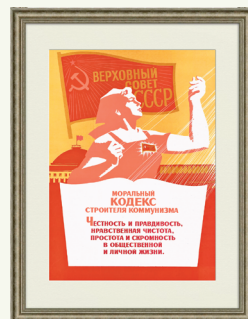
Плакат СССР. 1979 г.

3. Якія ідэі Маральнага кодэкса будаўніка камунізму з'яўляюцца актуальнымі і ў наш час?