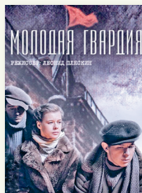
«Маладая гвардыя». Рэжысёр Л. Пляскін. 2015 г.