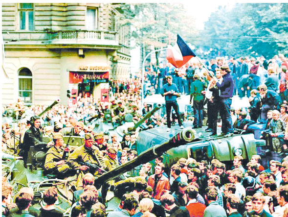
Падзеі «Пражскай вясны» 1968 г.

Параўнайце падзеі 1956 г. у Венгрыі і 1968 г. у Чэхаславакіі. Вылучыце агульнае і адрознае паміж гэтымі падзеямі.