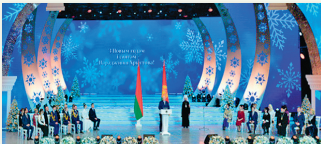
Церемония вручения премии Президента Республики Беларусь «За духовное возрождение». 2025 г.