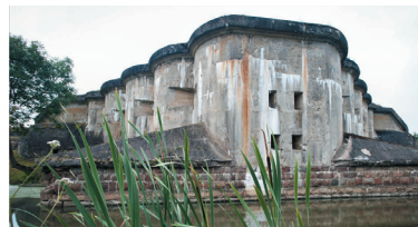
Брестская крепость. Пятый форт

В июне 2024 г. белорусские спортсмены впервые выступили на международных соревнованиях «Спортивные игры стран БРИКС». По итогам турнира Республика Беларусь заняла второе место в общекомандном