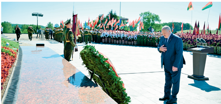
Мемориальный комплекс «Курган Славы». 3 июля 2025 г.

образования введена новая учебная дисциплина — «История белорусской государственности».