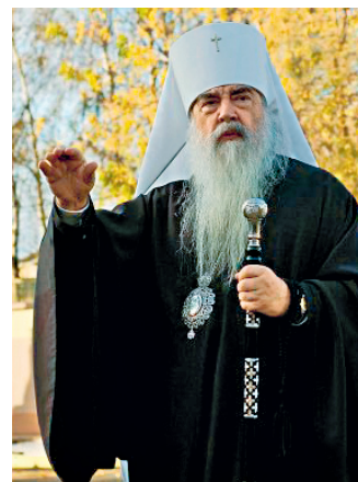
Герой Беларуси Митрополит Филарет (Вахромеев)

Белорусское государство в полной мере обеспечивает реализацию права на свободу совести, предоставляет