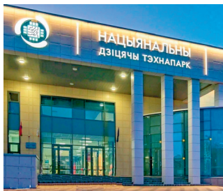
Национальный детский технопарк. Г. Минск

Конституция гарантирует гражданам Республики Беларусь право на охрану здоровья, включая бесплатное лечение за счет государственных средств в порядке, установленном законом. В то же время граждане обязаны заботиться о сохранении собственного здоровья. Эта обязанность предусмотрена Конституцией.