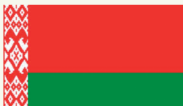
Государственный флаг Республики Беларусь