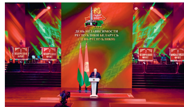
Торжественное собрание в честь Дня Независимости. 2024 г.

Верховный Совет БССР определил Днем независимости Беларуси дату принятия Декларации о государственном суверенитете. Однако большинство жителей Беларуси не стали воспринимать эту дату как начало отсчета суверенной государственности, поскольку она была связана с разрушением советского государства. На республиканском референдуме 1996 г. по предложению Президента Республики Беларусь А. Г. Лукашенко белорусы высказались за перенос празднования Дня Независимости на 3 июля — дату освобождения г. Минска от немецко-фашистских захватчиков. За это проголосовали 88,18 %