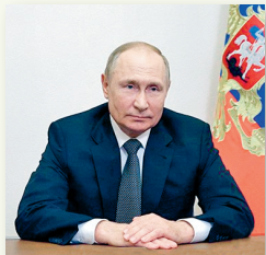
Президент Российской Федерации В. В. Путин