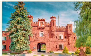
Мемориальный комплекс «Брестская крепость-герой»