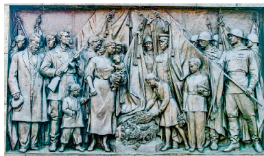
Слава павшим героям. Скульптор З. Азгур