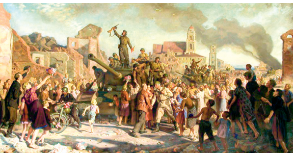
Минск. 3 июля 1944 г. Художник В. Волков. 1945–1955 г.