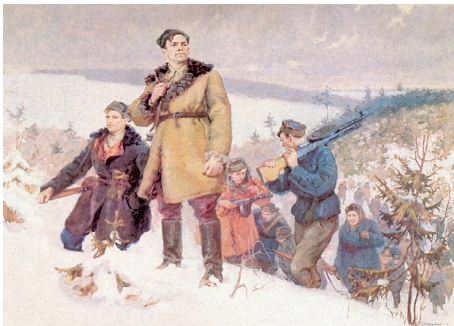
За родную Беларусь. Художник В. Суховерхов. 1948 г.

На рубеже 1950–1960-х гг. в советском изобразительном искусстве начинает формироваться направление, получившее название «суровый стиль». Осмысление трагедии Великой Отечественной войны, героизация подвига и трудовых будней, история Беларуси нашли отражение в произведениях М. Савицкого, В. Громыко,