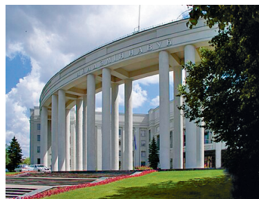
АН БССР награждена орденами Дружбы народов в 1975 г. и Ленина в 1978 г.