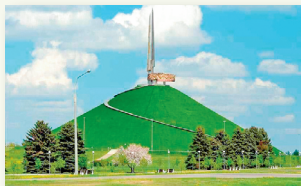
Мемориальный комплекс «Курган Славы Советской Армии — освободительницы Беларуси»