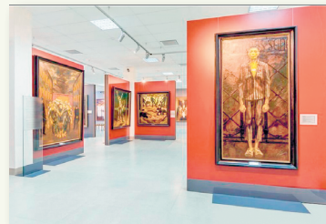
В залах художественной галереи М. Савицкого (г. Минск)

Цикл картин «Цифры на сердце» М. Савицкого стал самой известной серией картин об ужасах нацистских лагерей смерти. Живописец перенес на холст то, через что прошел сам в годы Великой Отечественной войны: немецкий плен, лагерь смерти.