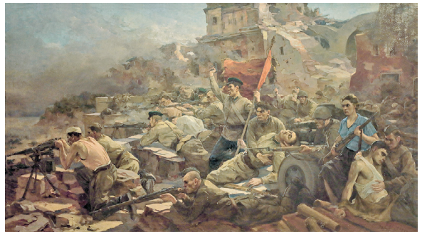
Оборона Брестской крепости в 1941 году. Художник Е. Зайцев. 1950 г.