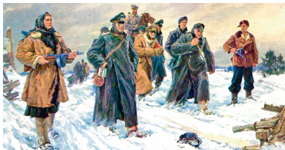
Пленных везут. Художник А. Шибнев. 1946 г.

Какие события Великой Отечественной войны отражены на представленных полотнах?