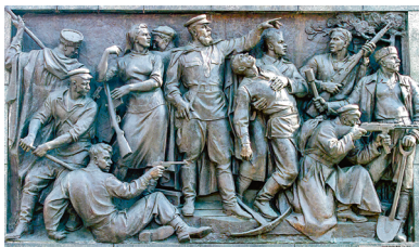
Партизаны Беларуси. Скульптор А. Глебов