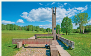
Мемориальный комплекс «Хатынь»