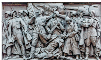
Советская Армия в годы Великой Отечественной войны. Скульптор С. Селиханов