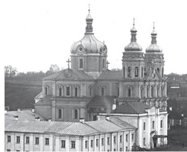
Свято-Николаевский собор (1843 г.). Г. Витебск. Взорван в 1957 г.

Важной вехой в деле возрождения православия в Беларуси стало празднование в 1988 г. 1000-летия Крещения Руси. С этого времени началось массовое открытие храмов и создание новых православных