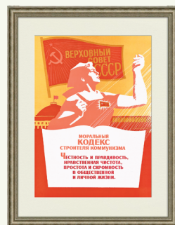
Плакат СССР. 1979 г.

3. Какие идеи Морального кодекса строителя коммунизма являются актуальными и в наше время?