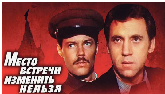
Место встречи изменить нельзя. Режиссер С. Говорухин. 1979 г.

Какие из советских кинофильмов получили премию «Оскар»?