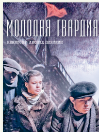
«Молодая гвардия». Режиссер Л. Пляскин. 2015 г.