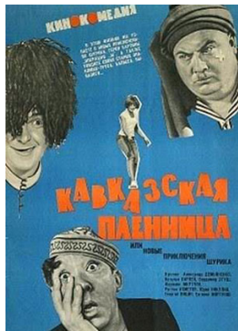
Кавказская пленница. Режиссер Л. Гайдай. 1967 г.

Периодом расцвета советского кинематографа стали вторая половина 1960-х — 1980-е гг. Именно в это время появились самые известные советские киношедевры.