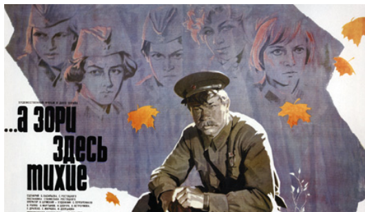
А зори здесь тихие. Режиссер С. Ростоцкий. 1972 г.