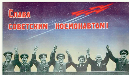
Плакат 1963 г. Авторы А. Костромичев, С. Раскин, В. Черников