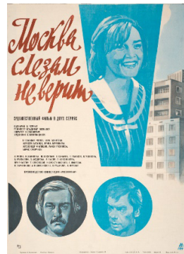
Москва слезам не верит. Режиссер В. Меньшов. 1979 г.