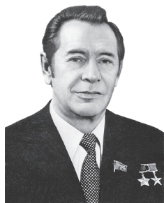
П. М. Машэраў. Першы сакратар ЦК КПБ (1965–1980)