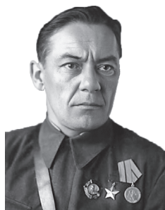
В. І. Казлоў. Старшыня Прэзідыума Вярхоўнага Савета БССР (1948–1967)