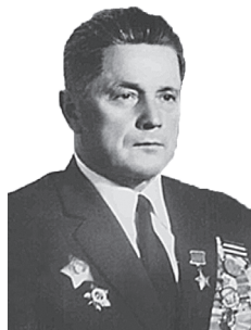
У. Е. Лабанок. Старшыня Прэзідыума Вярхоўнага Савета БССР (1976–1977)