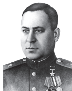
А. Я. Кляшчоў. Старшыня Савета Міністраў БССР (1948–1953)

Як вы лічыце, чаму кіраўнікамі рознага ўзроўню ў пасляваеннай БССР рабіліся арганізатары вызваленчай барацьбы? У якіх галінах улады займалі пасады В. І. Казлоў, У. Е. Лабанок і А. Я. Кляшчоў? Назавіце прозвішчы цяперашніх кіраўнікоў гэтых галін улады ў Рэспубліцы Беларусь.