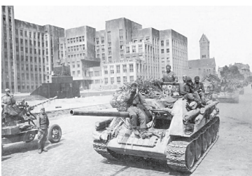
Дом урада. Г. Мінск. 1944 г.

На заключным этапе вайны беларуская дзяржаўнасць набыла геапалітычную вагу, што знайшло выяўленне ва ўдзеле БССР у стварэнні і дзейнасці пасляваенных міжнародных арганізацый.