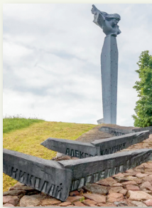
Г. п. Радашковічы