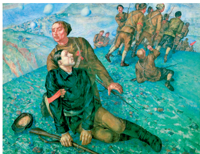
Смерць камісара. Мастак К. Пятроў-Водкін. 1928 г.

Сацыялістычны рэалізм — мастацкі метады літаратуры і мастацтва, які ўяўляе сабой эстэтычнае выяўленне сацыялістычна ўсвядомленай канцэпцыі свету і чалавека.