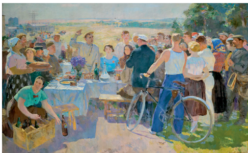
Калгаснае свята. Мастак С. Герасімаў. 1937 г.