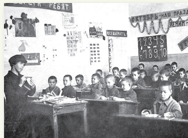
Адзіная працоўная школа. 1920-я гг.