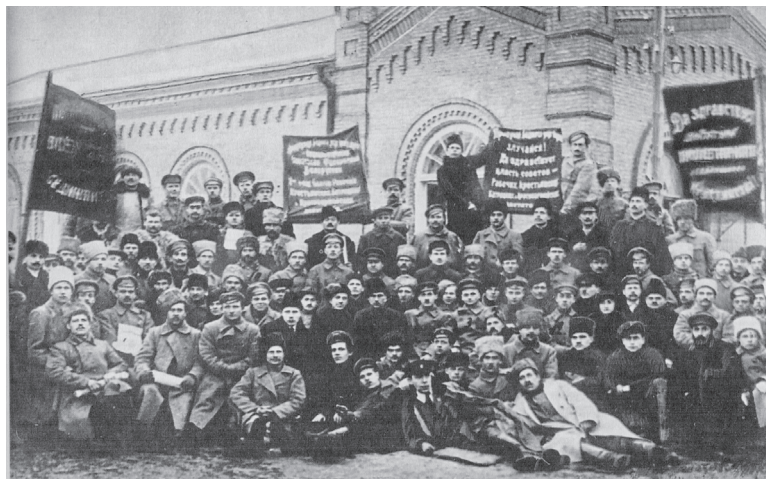
Дэлегаты I Усебеларускага з'езда Саветаў. Мінск, 2–3 лютага 1919 г.

Канстытуцыя ССРБ уключала ўсяго 32 артыкулы. У якасці прэамбулы выступала «Дэкларацыя правоў працоўных і эксплуатаванага народа». Канстытуцыя 1919 г. замацоўвала найважнейшыя палажэнні новай дзяржавы: вышэйшыя органы ўлады (з'езд Саветаў, ЦВК, Прэзідыум ЦВК), асноўныя правы і абавязкі грамадзян, герб і сцяг ССРБ і г. д.