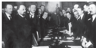
Падпісанне Рыжскай мірнай дамовы