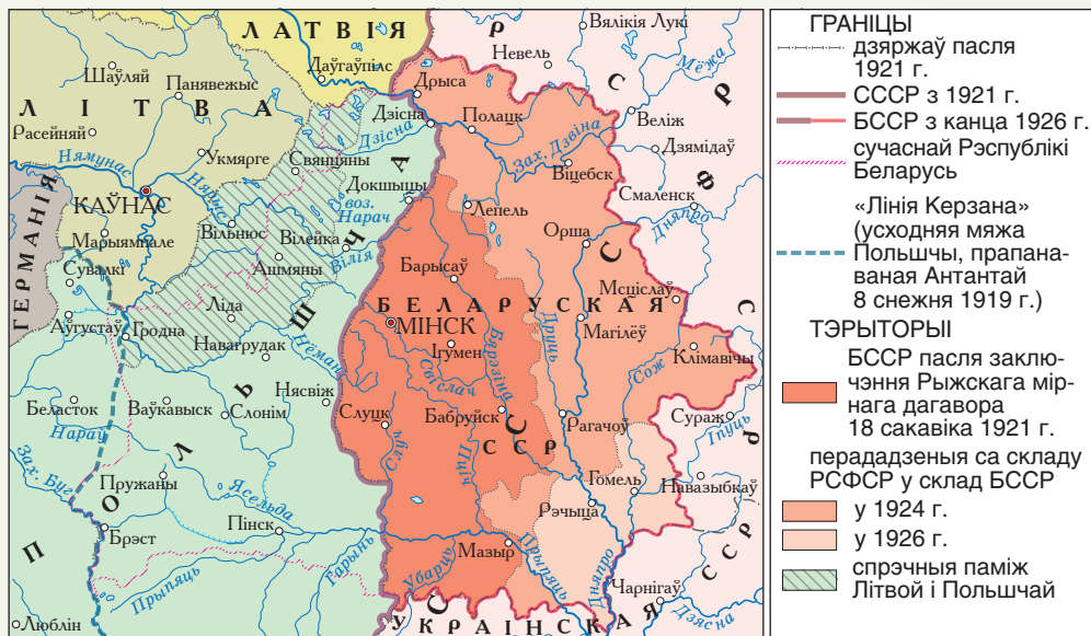
Фарміраванне тэрыторыі БССР у 1921–1926 гг.