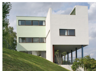
Жылы дом паводле праекту Ш. Э. Ле Карбюзье. 1927 г.