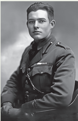
Эрнэст Хэмінгуэй. 1918 г.

Славу амерыканскі пісьменнік Эрнэст Хэмінгуэй пайшоў на фронт добраахвотнікам у 1918 г., быў паранены. У гады грамадзянскай вайны ў Іспаніі зрабіўся ваенным карэспандэнтам, знаходзіўся ў Мадрыдзе пад аблогай фашыстаў.