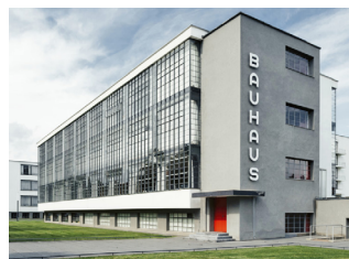
Школа Байхауз. Г. Дэсау (Германія)