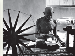
М. Гандзі за прасніцай

Адным з галоўных сімвалаў гандызму з'яўляецца прасніца. Прадзільны калаўрот быў выяўлены на сцягу ІНК. На першым варыянце сцяга будучай незалежнай Індыі прапаноўвалі намаляваць прасніцу, якую потым замяніла кола чакра (як сімвал вечнага руху).