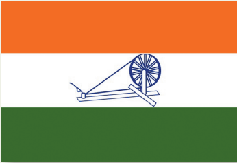
Сцяг ІНК (1934 г.)