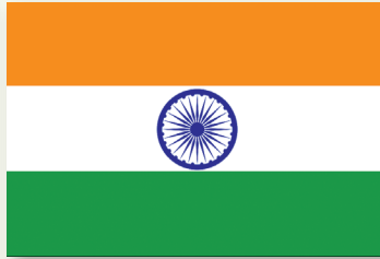
Сцяг сучаснай Індыі