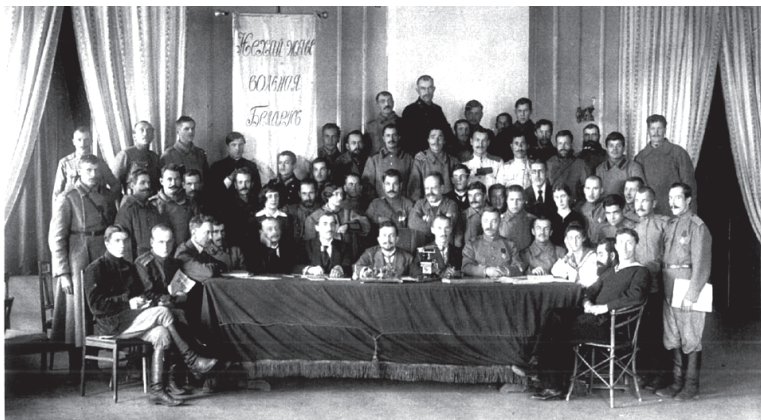
Сумеснае пасяджэнне ВБР і Цэнтральнай беларускай вайскавой рады. 1917 г.

масвядомасць сялянства, самага шматлікага класа беларускага грамадства, не вызначалася высокім узроўнем.