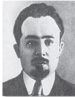
К. І. Ландэр, першы старшыня СНК