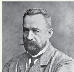
Георгій Яўгенавіч Львоў

У. І. Ленін прыйшоў да вываду, што для бальшавікоў склалася ўнікальная сітуацыя, каб захапіць уладу. 24 кастрычніка (6 лістапада) 1917 г. пад кіраўніцтвам Петраградскага Савета пачалося ўзброенае паўстанне ў сталіцы. У ім актыўны ўдзел узялі салдаты гарнізона, маракі Балтыйскага флоту, рабочая Чырвоная гвардыя, якія 25 кастрычніка (7 лістапада) практычна без супраціву ўсталявалі кантроль над Петраградам. У ноч на 26 кастрычніка (8 лістапада) Часовы ўрад быў арыштаваны.