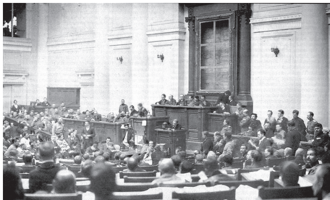
І Усерасійскі з'езд Саветаў рабочых і салдацкіх дэпутатаў

сітуацыяй, большавікі арганізавалі ў Петраградзе маніфестацыі пад лозунгам «Уся ўлада Саветам!». Часовы ўрад пры падтрымцы Петрасавета гэтыя выступленні задушыў. Перыяд двоеўладдзя скончыўся, бо Саветы перайшлі на пазіцыю поўнай падтрымкі Часовага ўрада. Новы Часовы ўрад, у які ўвайшлі восем кадэтаў і блізкіх да гэтай партыі палітыкаў і сем міністраў, якія прадстаўлялі ўмераныя сацыялістычныя партыі эсэраў і меншавікоў, узначаліў эсэр А. Керанскі.