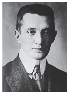
А. Ф. Керанскі

сітуацыяй, большавікі арганізавалі ў Петраградзе маніфестацыі пад лозунгам «Уся ўлада Саветам!». Часовы ўрад пры падтрымцы Петрасавета гэтыя выступленні задушыў. Перыяд двоеўладдзя скончыўся, бо Саветы перайшлі на пазіцыю поўнай падтрымкі Часовага ўрада. Новы Часовы ўрад, у які ўвайшлі восем кадэтаў і блізкіх да гэтай партыі палітыкаў і сем міністраў, якія прадстаўлялі ўмераныя сацыялістычныя партыі эсэраў і меншавікоў, узначаліў эсэр А. Керанскі.