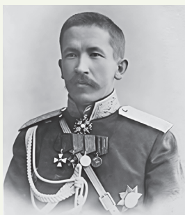
Лаўр Георгіевіч Карнілаў

Актыўны ўдзел бальшавікоў у барацьбе з карнілаўскім мяцяжом павысіў іх папулярнасць. Яны здабылі большасць у Петраградскім і Маскоўскім саветах. А Часовы ўрад усё больш траціў магчымасць уплываць на сітуацыю ў краіне. Нарастаў эканамічны крызіс, буйныя гарады сутыкнуліся з пагрозай голаду. Рос стачачны рух. Складаная была сітуацыя на фронце.