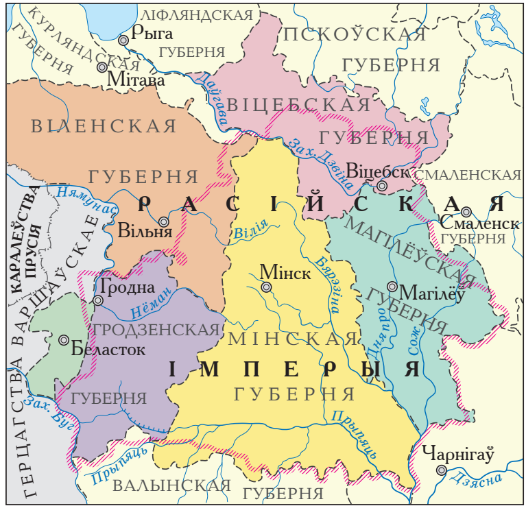
Тэрыторыя Беларусі ў складзе Расійскай імперыі ў 1807–1813 гг.