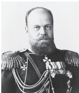
Аляксандр III. Фотаздымак 1880-х гг.

патрэбы, якія тычыліся ўсіх саслоўяў і катэгорый насельніцтва, у той жа час абмежавала інтарэсы пануючага дваранскага саслоўя. Аднак урад Аляксандра II ні ў якой меры не прадугледжваў змянення палітычнага ладу.