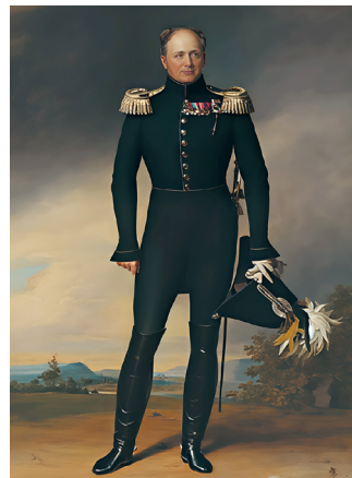
Аляксандр I. Мастак Д. Доу. 1825 г.

Рэформы дзяржаўнага кіравання ў Расіі ў першай палове XIX ст. былі звязаныя з імем М. М. Спяранскага. Таленавіты чыноўнік па даручэнні імператара падрыхтаваў план дзяржаўных пераўтварэнняў «Увядзенне да Улажэння дзяржаўных законаў» (1809 г.).