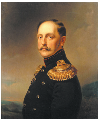
Мікалай I. Мастак Я. І. Ботман. 1859 г.

Для каардынацыі дзейнасці міністэрстваў у 1802 г. быў створаны новы орган — Камітэт міністэрстваў. Урадам у сучасным значэнні яго яшчэ нельга было назваць, гэта была нарада міністэрстваў пад старшынствам самога імператара.