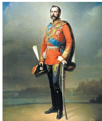
Аляксандр II. Мастак М. А. Лаўроў. 1873 г.

Успомніце, у чым палягалі Вялікія рэформы. Што значыў усесаслоўны характар органаў мясцовага самакіравання?