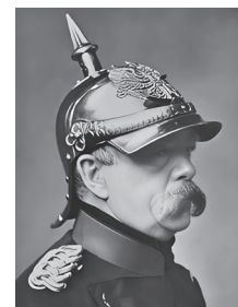
О. фон Бісмарк