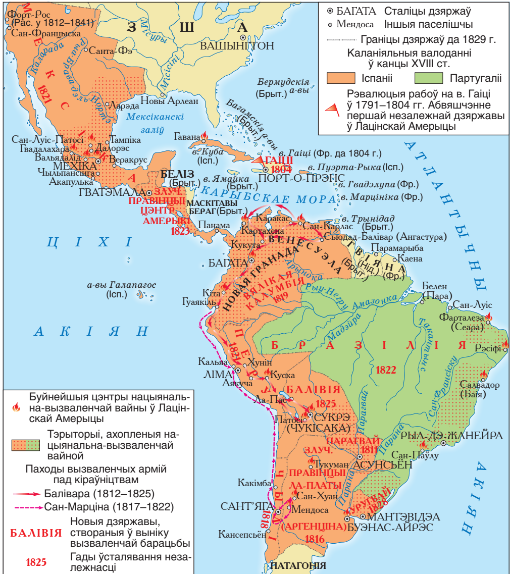
Лацінская Амерыка ў першай палове XIX ст.

Якія новыя дзяржавы ўзніклі ў Лацінскай Амерыцы ў выніку Вайны за незалежнасць? Выкарыстоўваючы сучасную палітычную карту свету, вызначце, якія з гэтых дзяржаў існуюць у наш час.