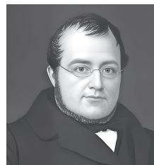
К. Б. Кавур