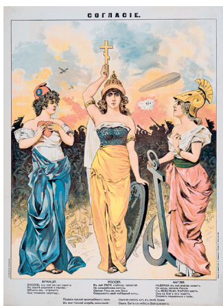
Антанта. Плакат 1914 г.

3. Прычыны і характар Першай сусветнай вайны. Першая сусветная вайна паўстала вынікам супярэчнасцей паміж асноўнымі еўрапейскімі дзяржавамі. Да пачатку вайны прывёў шэраг фактараў.