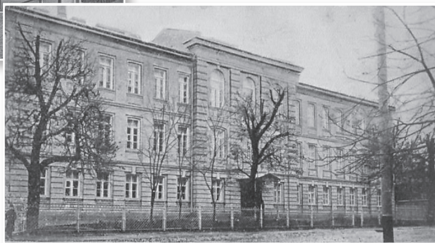
Гродзенская жаночая Марыінская ģимназія

Пры дапамозе дадатковых крыніц інфармацыі даведаецца, якія яшчэ навучальныя ўстановы былі адкрытыя ў другой палове XIX — пачатку XX ст. у Беларусі.