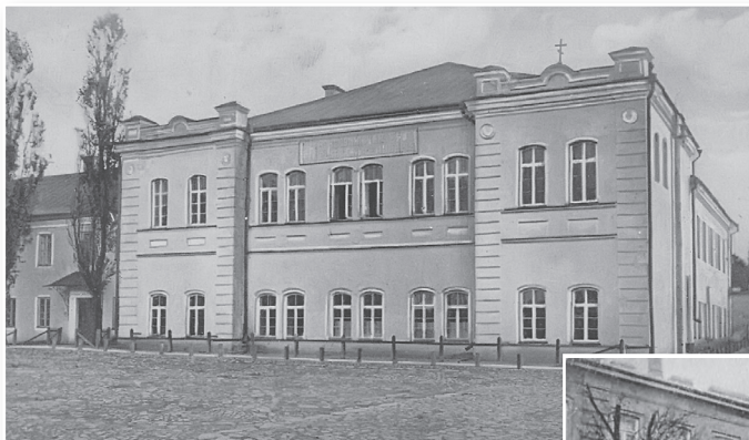
Нясвіжская настаўніцкая семінарыя