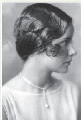
Алаіза Пашкевіч (Цётка)

Выкарыстоўваючы дадатковыя крыніцы інфармацыі, даведайцеся, які ўнёсак у развіццё адукацыі на тэрыторыі Беларусі зрабілі класікі беларускай літаратуры Алаіза Пашкевіч (Цётка) і Канстанцін Міцкевіч (Якуб Колас). Падрыхтуйце паведамленне (або прэзентацыю).