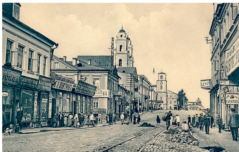
Мінск у пачатку XX ст.

Разгледзьце фотаздымак горада Мінска ў пачатку XX ст. Якія адрозненні ад сучаснага горада вы заўважылі?