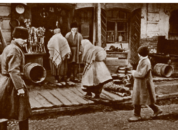
Крамны гандаль у Пінску. Канец XIX ст.

Як вы лічыце, чаму ў другой палове XIX ст. павялічылася роля ў развіцці гандлю магазінаў і крам? З чым гэта звязана?