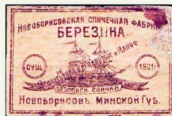
Этыкетка прадукцыі запалкавай фабрыкі «Бярэзіна»

Ад 1909 г. у эканамічным развіцці Беларусі назіраўся новы прамысловы ўздым, які працягваўся да пачатку Першай сусветнай вайны. Тэмпы развіцця прамысловасці Беларусі ў гэты час былі вышэйшыя, чым сярэднія паказчыкі па Расійскай імперыі, — сярэднегадавы прырост прамысловай вытворчасці склаў 13,9%. Апераджальнымі тэмпамі развівалася фабрычна-заводская прамысловасць.