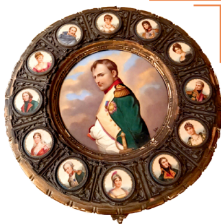
Стальніца з партрэтамі Напалеона і членаў яго сям'і

Паразважайце, з якой мэтай Напалеон Банапарт рабіў сваіх родзічаў манархамі еўрапейскіх дзяржаў.