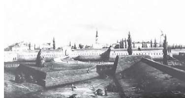
Бабруйская крэпасць. XIX ст.

Падумайце, што значыць выраз «дванадзесяць языкоў».