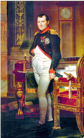
Імператар Напалеон у сваім кабінете ў Цюільры. Мастак Давід Жак-Луі

Карыстаючыся дадатковымі крыніцамі інфармацыі, складзіце табліцу «Вынікі напалеонаўскіх войнаў», адлюструйце ў ёй вынікі ўсіх вышэйзгаданых ваенных кампаній. Зрабіце вывад наконт уплыву напалеонаўскіх войнаў на развіццё Еўропы напачатку XIX ст.